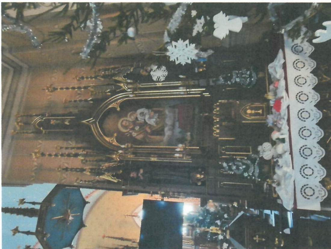
2. Ołtarz boczny prawy z rzeźbami Św. Antoniego i Św. Franciszka.