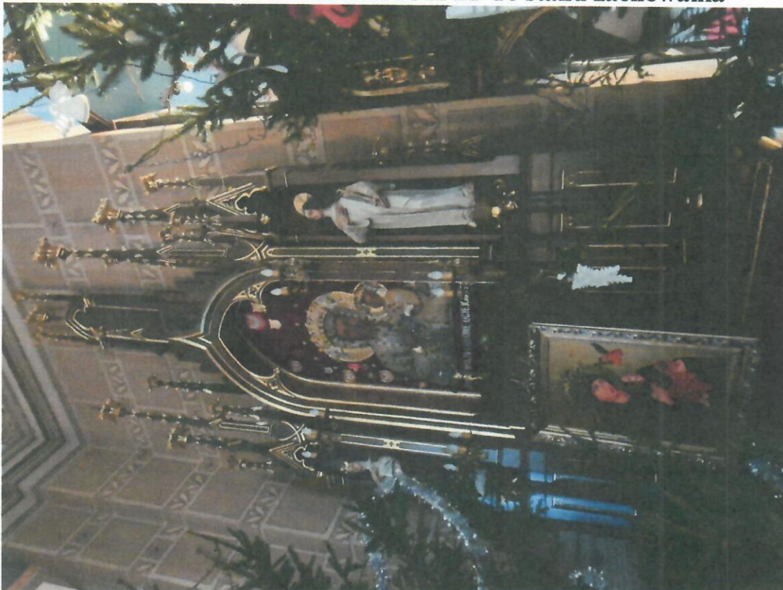
1. Miastków Kościelny, kościół p.w. Nawiedzenia NMP. Ołtarz boczny lewy z niezidentyfikowanymi świętymi w habitach zakonnych.